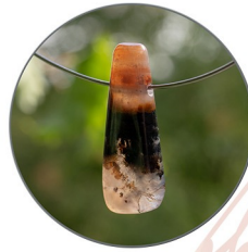
SARDONYX dreifarbiger Chalcedon für alle Sinne