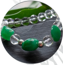
CHRYSOPRAS gilt als Ent- giftungsstein No 1