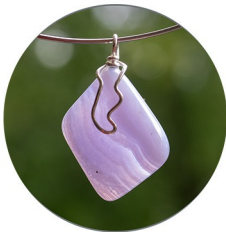
CHALCEDON (blau gebändert) bringt alles in Fluss