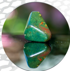
HELIOTROP Hildegard-Jaspis gilt als Ecchinacin der Steinheilkunde

Je nach Art des Steines ist das Aufkleben auf Organe, im Wasser oder als Schmuck getragen eine von vielen Möglichkeiten. Edelsteine sind immer nur eine begleitende und keine medizinische Maßnahme. Jeder handelt eigenverantwortlich und entscheidet selbst, ob und inwieweit sie für ihn eine Alternative zur Homöopathie oder Schulmedizin darstellen.