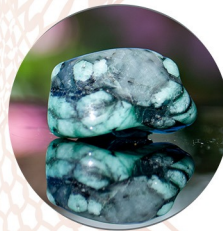
SMARAGD Grüne Göttin der Edelsteine